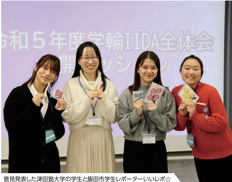
意見発表した津田塾大学の学生と飯田市学生レポーターいいレポ☆