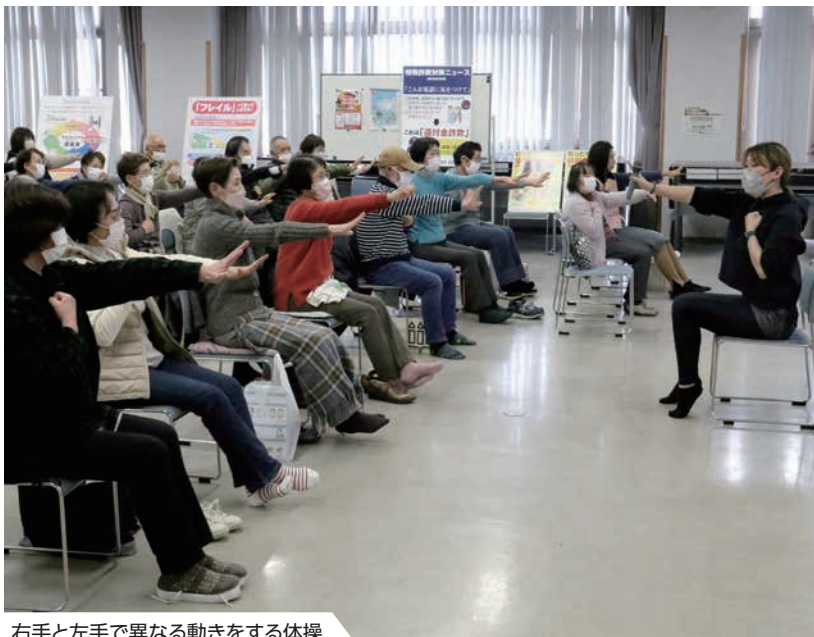
右手と左手で異なる動きをする体操