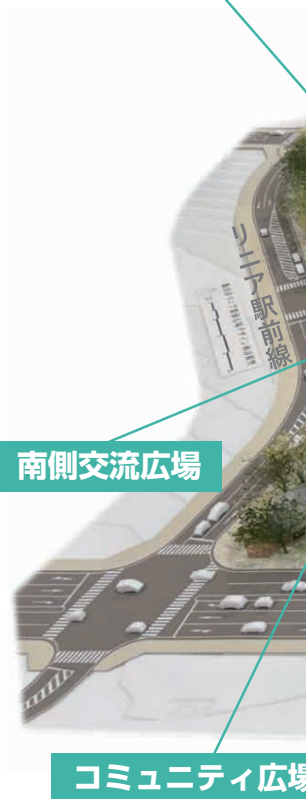
コミュニティ広場