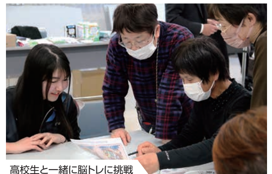
高校生と一緒に脳トレに挑戦

2月1日フレイルの日に「フレイル予防の集い」を初めて開催しました。「フレイル」とは、「健康」と「要介護」の中間の状態のことで、生活習慣を見直すことで健康な状態に戻ることができると言われています。